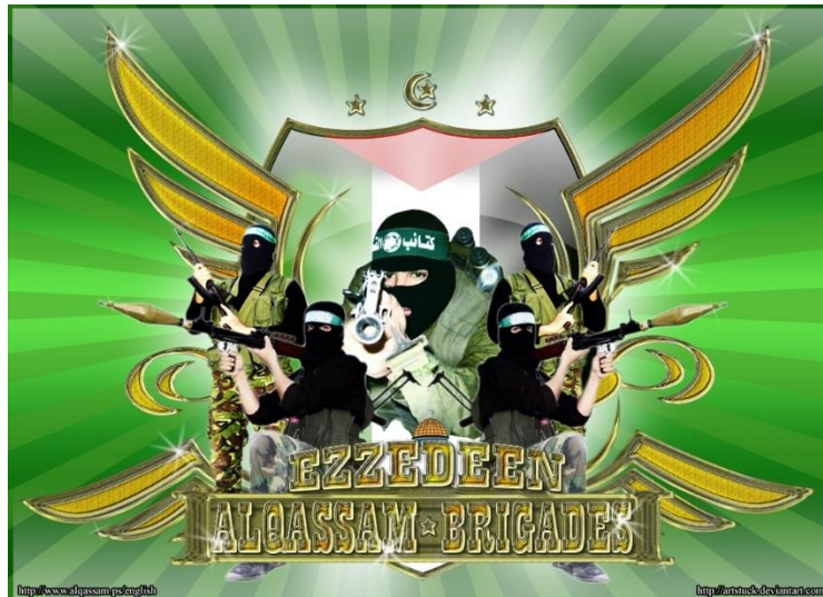
Abbildung 1: Qassam-Brigaden beschwören den Spirit von Jihad

Es ist eine Tatsache, dass Mohammed zur Gewaltfrage ein weitaus weniger eindeutiges Verhältnis als Jesus, Buddha, Milarepa (Tibet), Deganawida (Irokesen) oder Lao Tse hatte.