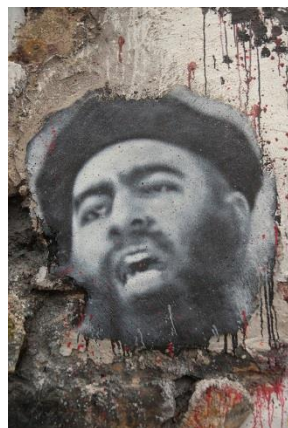
Abbildung 4: Abu Bakr al Baghdadi

Der IS verdrängte bei Jihadfans Al-Qaida auf Platz 2 der Beliebtheitshitliste der islamistischen Terrororganisationen. Für jugendliche Sympathisanten sind die Terrormilizen einfach „TOP“. 2013 musste ein großer Anstieg von jugendlichen IS-Anhängern in Europa erkannt werden (mindestens 2000, die Dunkelziffer ist sicher deutlich höher.) Der Autor drückt seine Betroffenheit darüber aus, wie attraktiv abgeschlagene Köpfe sein können. „In unserer voyeuristischen virtuellen Gesellschaft [...] ist ansprechend verpackter Sadismus zu einer beliebten Show geworden.“ 11 Nach den IS-Erfolgen liefen viele Vertreter rivalisierender islamistischer Milizen (jihadistische Wendehälse) zu der salafistisch-sunnitischen Extremsekte über. Deren Chef ist Abu Bakr al Baghdadi , der sich als Nachfolger Mohammeds empfindet und als „Gebiet der Gläubigen“ absoluten Gehorsam fordert. Er pocht auf sein „Recht“, einen Eroberungsfeldzug durchzuführen und allen Muslimen zu befehlen, ihre Heimatgebiete zu verlassen und in das neue Kalifat zu ziehen. Die Übersiedelung in das „Haus des Islam“ wird als Pflicht verkündet. Abu Bakr al Baghdadi umgibt sich mit der Aura des Geheimnisvollen, nutzt die im Islam verankerte Utopie der Rückkehr des Propheten, in dem er die Überzeugung seiner Anhänger nährt, das er selbst der wiedergekommene Prophet sei.