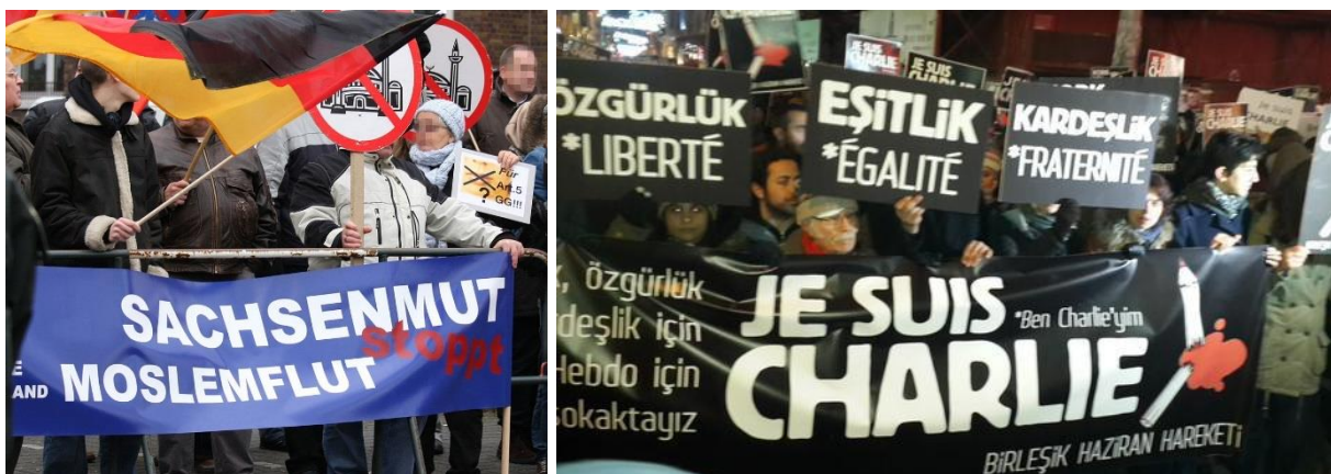
Abbildung 5 (links) & Abbildung 6 (rechts): Rechts und Links machen gegen den Islamismus mobil, wobei die extreme Rechte generell gegen den Islam an sich aufmarschiert. Viele Demokraten marschieren unter der Losung „Je suis Charlie“ auf. Die berühmten Mohammed-Karikaturen werden wegen ihrer Untergriffigkeit auch von Vertretern der Meinungsfreiheit kritisiert.

Massiv betreibt der IS die Indoktrination der Bevölkerung. Ein Verbot der Demokratie zählt zu den wichtigsten Glaubenssätzen. Auch polemisiert der IS gegen (das Konzept der) Nationalstaaten und deren Grenzen die – in dieser Region völlig zu Recht – als Erbe des Kolonialismus betrachtet werden und meist nach dem Zusammenbruch des Osmanischen Reichs gezogen wurden. Ethnien, miteinander verbundene Völker und Stämme wurden so getrennt. Laut dem IS benötigen Muslime keine Grenzen. Die Islamisten sind bemüht, mit ihren Ideen vor allem Kinder und Jugendliche zu erreichen . Werden die eroberten Gebiete längere Zeit gehalten, entstehen hier junge, manipulierte Menschen – jihadistische Kampfmaschinen der Zukunft . Um längerfristig zu herrschen bemüht sich der IS, staatliche Strukturen aufzubauen: Gerichte, Polizei, Schulen, natürlich im Sinn der Scharia, Sozialleistungen sollen die vom Terror geschockte Bevölkerung auf die Seite der Terroristen ziehen. Zusätzlich bemühen sich die IS-Verantwortlichen, die erstaunlichen Erfolge der Bewegung – u.a. die Erbeutung von US-Panzern durch relativ wenige Islamisten von der zahlenmäßig um ein Vielfaches überlegenen irakischen Armee unter dem Motto „Gott ist mit uns“ – zu vermarkten.