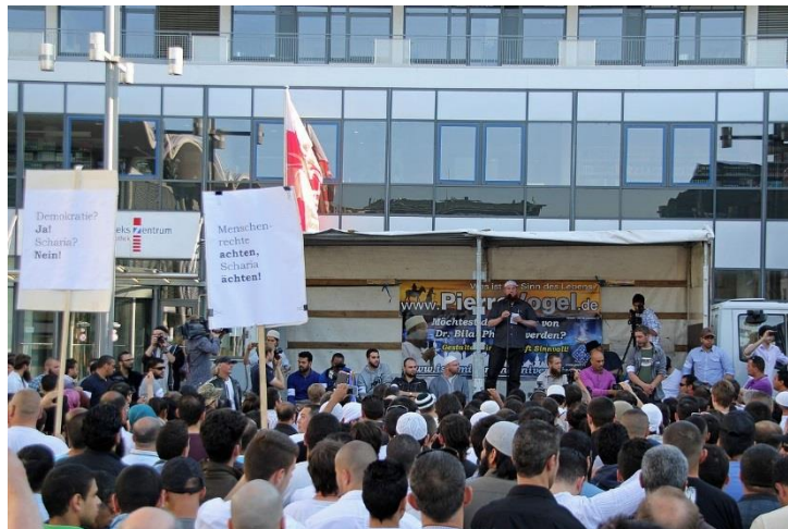
Abbildung 2: Pierre Vogel – Islamistischer Missionar – bei Kundgebung in Koblenz 2011

Als erste salafistische Lehre gilt der saudische Wahhabismus , der auf Muhammad ibn Abd al-Wahhab (1703 – 1792) zurückgeht. Der Salafismus war früher meist unpolitisch, setzte vor allem auf Veränderung durch gelebte Moral und grenzte sich von Gewalt ab. Das ist heute Geschichte. Früher bekamen Salafisten eine lange religiöse Ausbildung, man legte Wert auf gepflegte Sprache und Verhaltensweisen. Angestrebt wurde und wird eine Rückkehr zum Vorbild der „lauteren Vorfahren“ und zum „reinen Islam“ der Gründerzeit. Als unislamisch galten Sufis und Schiiten. Als Ungläubige (Kuffar) wurden alle Menschen betrachtet, die sich nicht dem salafitischen Islamverständnis unterwarfen. Dieser elitäre Salafismus erfuhr nun eine Proletarisierung. Wie in den esoterischen Instantseminaren finden wir Kurzurse für islamische Schulung. Diese jihadistischen Schnellkurse ermöglichen es, dass Adepten in wenigen Wochen zu Gotteskriegen manipuliert werden. Salafismus gebärdet sich heute als Protestbewegung , in der auch junge Deutsche und Österreicher ihre radikale Ablehnung gegen das System äußern können. Die Verwendung einer bei der Jugend üblichen Sprache im Internet ermöglicht eine niedrigschwellige Kommunikation mit Jugendlichen. Dazu erschien im Rahmen der LOGO ESO.INFO die aussagekräftige Studie von Stefan Ederer „Propaganda 2.0“ 8 .