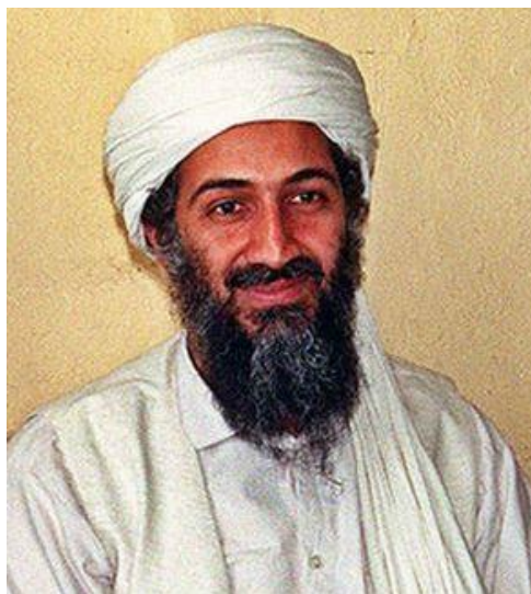
Abbildung 3: Osama bin Laden

Der Islam der Taliban ist ein Ideologieimport. Es ist ein puritanischer, fundamentalistischer Islam (Wahabbismus), wie er sonst nur in Saudi Arabien anzutreffen ist. Von dort stammte auch der vermutlich 1957 geborene Osama bin Laden , als 17. von 57 Kindern. Mit seinem großen Familienvermögen und tatkräftiger Unterstützung durch die CIA rekrutierte er tausende Araber zum Kampf gegen das Böse. Ursprünglich waren die Kommunisten das Ziel, die Afghanistan besetzt hielten. Heute bilden diese Kämpfer den Kern von Al-Qaida („Basis“), wie das Terrornetzwerk des später von den USA liquidierten Bin Laden heißt. Mit seiner fundamentalistischen Ideologie und finanziellen Zuwendungen gewann Bin Laden immer mehr Einfluss auf die Taliban.