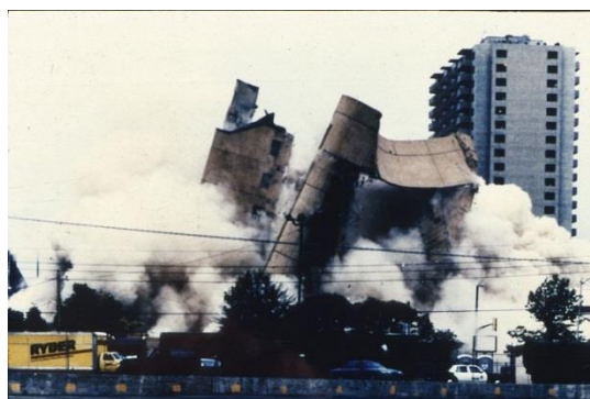
Abbildung 7: Christlich fundamentalistisch rechtsextremistisches Attentat in Oklahoma City